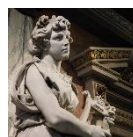
Arts et musique