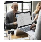
Entreprise et emploi