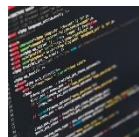
Programmation et multimédia