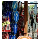
Code de la route