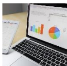
Bureautique et initiation