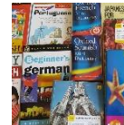
Langues étrangères FLE et LSF